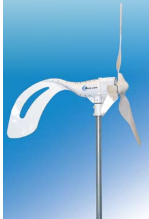
Husstandsvindmøllen er et af de bæredygtige tiltag, man må forvente at se flere af i de kommende år.